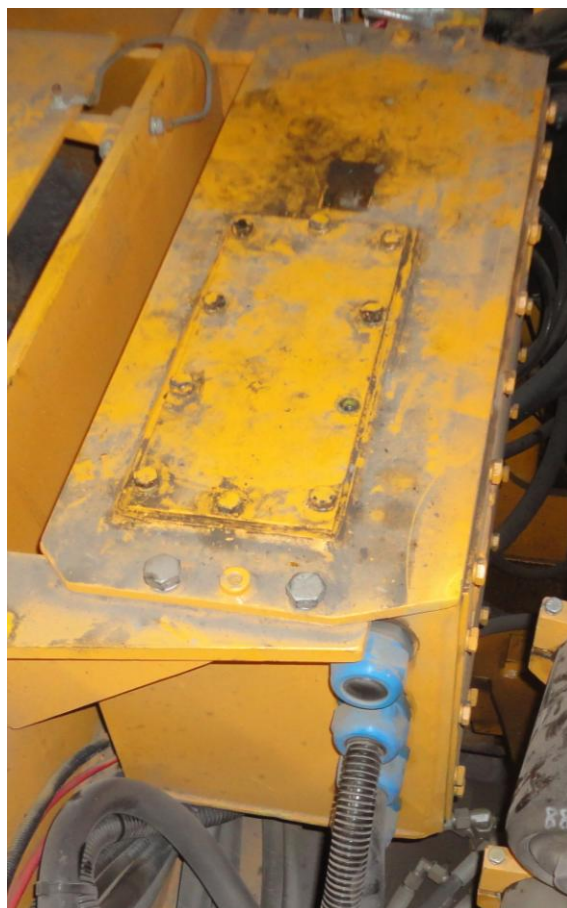
Rys. 3. Moduł aparatury zabudowany na wozie strzelniczym [2]

W tabeli 2 przedstawiono podstawowe dane techniczne modułu aparatury.