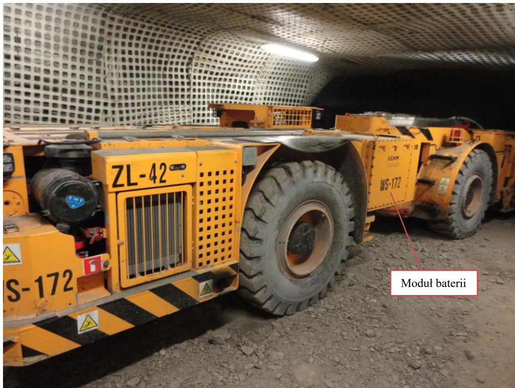
Rys. 6. Samojezdny wóz strzelniczy WS-172 kopalni rudy miedzi [2]

Akumulatorowy układ zasilania umożliwia pracę wozu strzelniczego bez dodatkowego czasu na niebezpieczną i uciążliwą czynność rozwijania i zwijania 100-metrowego przewodu elektrycznego i jest gotowy do pracy od momentu dojazdu wozu do przodka. Moduł baterii jest monitorowany w czasie rzeczywistym. Podstawowe informacje, zarówno podczas pracy, jak i ładowania baterii, wyświetlane są na panelu umieszczonym na obudowie modułu baterii, modułu ładowania oraz na pulpicie operatora, wewnątrz kabiny wozu strzelniczego.