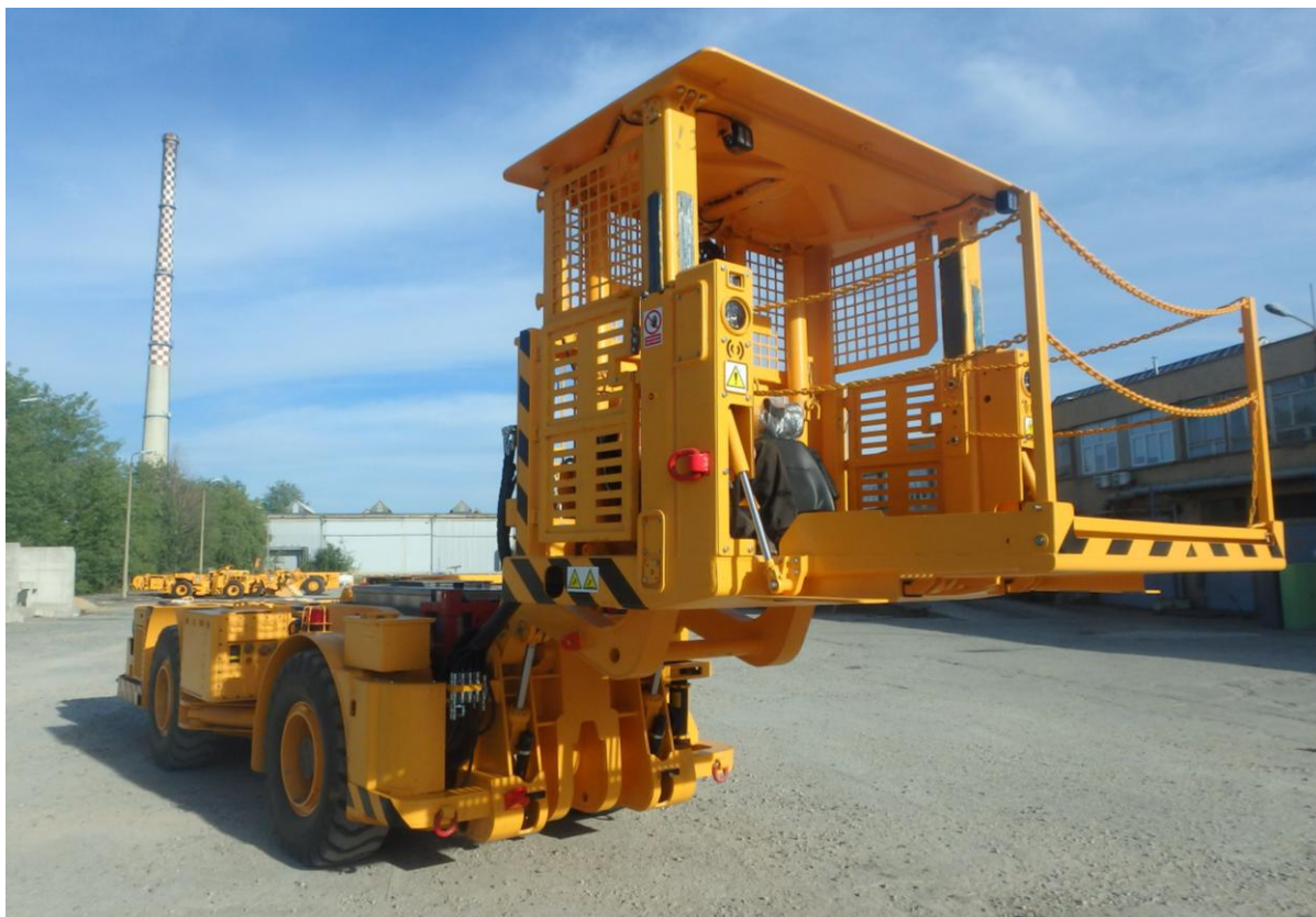
Rys. 5. Samojezdny wóz strzelniczy WS-172 [3]

Akumulatorowy układ zasilający został zastosowany w samojezdnym wozie strzelniczym WS-172 produkcji KGHM-ZANAM (rys. 5).