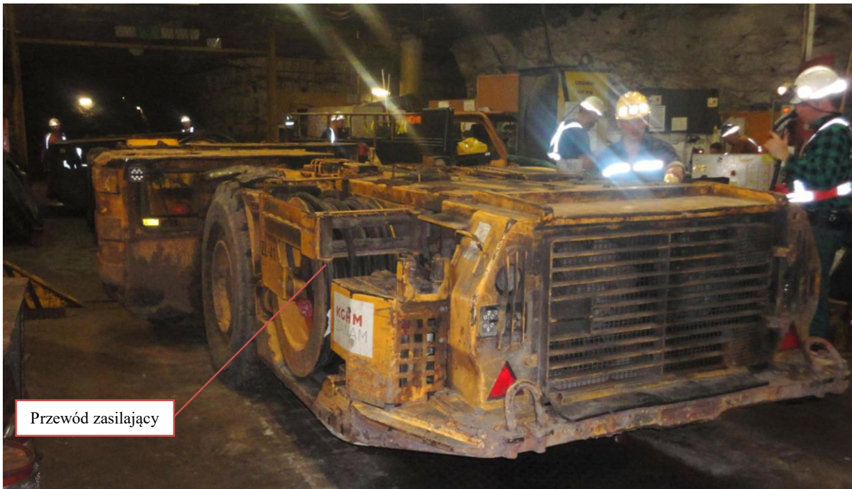
Rys. 1. Samojezdny wóz strzelniczy WS-151 produkcji KGHM-ZANAM [2]

W niniejszym artykule przedstawiono, opracowane w Instytucie Techniki Górniczej KOMAG w Gliwicach, nowe akumulatorowe rozwiązanie układu zasilającego samojezdnego wozu strzelniczego produkcji KGHM-ZANAM.