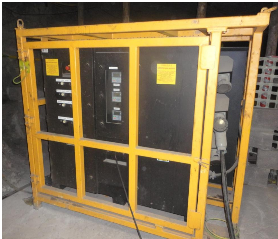
Rys. 4. Moduł ładowania zainstalowany w podziemiach kopalni [2]

Moduł ładowania zasilany jest z kopalnianej sieci elektroenergetycznej o napięciu znamionowym 500 V z uziemionym punktem neutralnym transformatora.