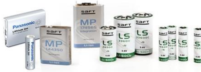
Rys. 4. Ogniwa litowo-jonowe [1]

Głównymi zaletami ogniw litowo-jonowych są niska masa, mała objętość ogniwa, wysokie napięcie jednostkowe, brak efektu pamięci, wysoka gęstość energii, długa żywotność i niskie samorozładowanie. Baterie litowo-jonowe są powszechnie stosowane w nowoczesnym sprzęcie elektronicznym.