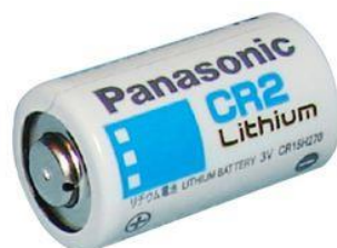
Rys. 3. Ogniwo litowo-manganowe [1]

Ogniwa litowo-manganowe (rys. 3) są ogniwami przeznaczonymi do pracy w warunkach wysokoprądowych. W tych komórkach anoda wykonana jest z litu, zaś materiałem reakcyjnym jest sproszkowany dwutlenek manganu.