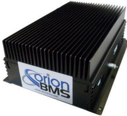
Rys. 6. BMS 2.0 ORION [7]

W przypadku opracowanego systemu zasilania urządzenia wierzącego zdecydowano się na system BMS 2.0 ORION (rys. 6).