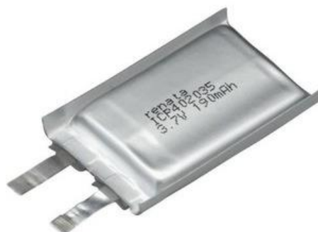
Rys. 2. Ogniwo litowo-polimerowe [1]

Ogniwa te posiadają hermetyczną obudowę o wysokiej elastyczności. Nie wydzielają gazów podczas normalnej pracy. Zaciski ogniwa wykonane są z dwóch metalowych pasków: aluminium i niklu, które dodatkowo pełnią funkcję bezpiecznika. Taki układ zacisków umożliwia fizyczną ochronę ogniwa przed zewnętrznym zwarcie. Producent podaje maksymalne napięcie rozładowania 3 V, poniżej tej wartości należy odłączyć i ładować ogniwo. Nie należy dopuścić do głębszego rozładowania, ponieważ niekorzystnie wpływa to na żywotność ogniwa. Podobnie przy maksymalnym napięciu ładowania producent podaje 4,15 V, dalsze przeładowanie ogniwa może spowodować jego uszkodzenie i niekorzystnie wpłynąć na jego żywotność.