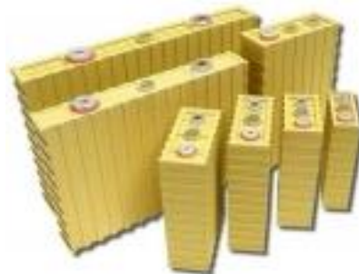
Rys. 5. Ogniwa litowo-żelazowo-fosforanowe [1]

Ogniwa litowo-żelazowo-fosforanowe (rys. 5) są obecnie coraz częściej stosowane zarówno w przemyśle motoryzacyjnym, jak i przemyśle ciężkim.