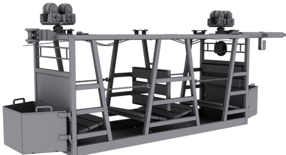
Rys. 1. Model 3D kabiny do przewozu osób

Analizę ergonomiczną wykonano z wykorzystaniem oprogramowania Anthropos Ergomax [1]. Dla odwzorowania sylwetek pasażerów przyjęto model 50-percentylowy, o wymiarach charakterystycznych dla 50% procent populacji mężczyzn [2].